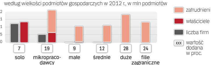
Struktura pozarolniczej działalności gospodarczej w Polsce według wielkości podmiotów gospodarczych w 2012 r., w mln podmiotów

Przy alokacji do poszczególnych klas wielkości uwzględniono powiązania własnościowe między przedsiębiorstwami.